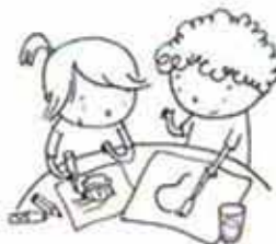
LINGUAGGI "CREATIVITA" ESPRESSIONE