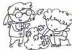
CONOSCENZA DEL MONDO

L'insegnamento della Religione Cattolica mi offre la possibilità di diventare "grande", aiutandomi a riflettere sulle esperienze che faccio e a dare risposte alle mie domande sul significato di ciò che vivo e vedo, quindi a conoscere meglio tutto quello che mi circonda.