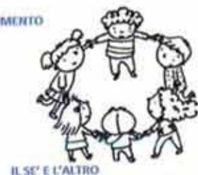
IL SÈ E L'ALTRO